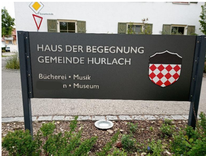
Haus der Begegnung - Schild

Gesucht wird: Das Haus der Begegnung in der Gemeinde Hurlach