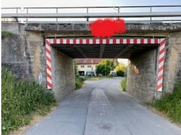
Bahnunterführung Leonhardstraße

Gesucht wird: Bahnunterführung Leonhardstraßen im Markt Kaufering