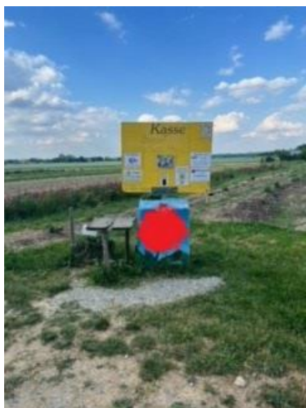
Schild vor Blumenfeld

Gesucht wird: Blumenfeld zum Selberpflücken in der Gemeinde Pürgen