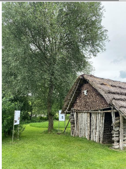
Steinzeitdorf Pestenacker