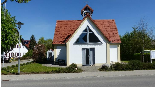
Friedenskapelle St. Josef

Gesucht wird: Die Ökumenische Friedenskapelle St. Josef in der Gemeinde Obermeitingen